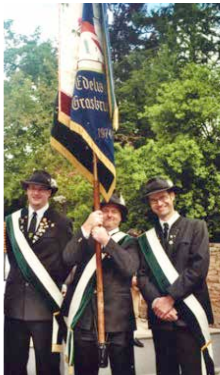
Die Fahnenabordnung der Edelweiß-Schützen

den Rundenwettkämpfen aktiv sind und sich verlässlich für Vereinsbelange engagieren. Bestärkt durch das rege Vereinsleben entschloss sich die Vorstandschaft, anlässlich des 40-jährigen Jubiläums erneut das Gauschießen auszurichten. Seit Januar 2013 arbeiten die Mitglieder des Ausschusses für das Gelingen dieses großen Vorhabens und tun ihr Bestes, um an den grandiosen Erfolg von 1999 anzuknüpfen. Allen Teilnehmern wünschen die Edelweiß-Schützen „Gut Schuss“ und erinnern an ihr Motto: „Wie's trifft, trifft's“!